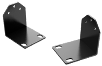
DW-G419RE Orejetas de montaje en rack de 19"